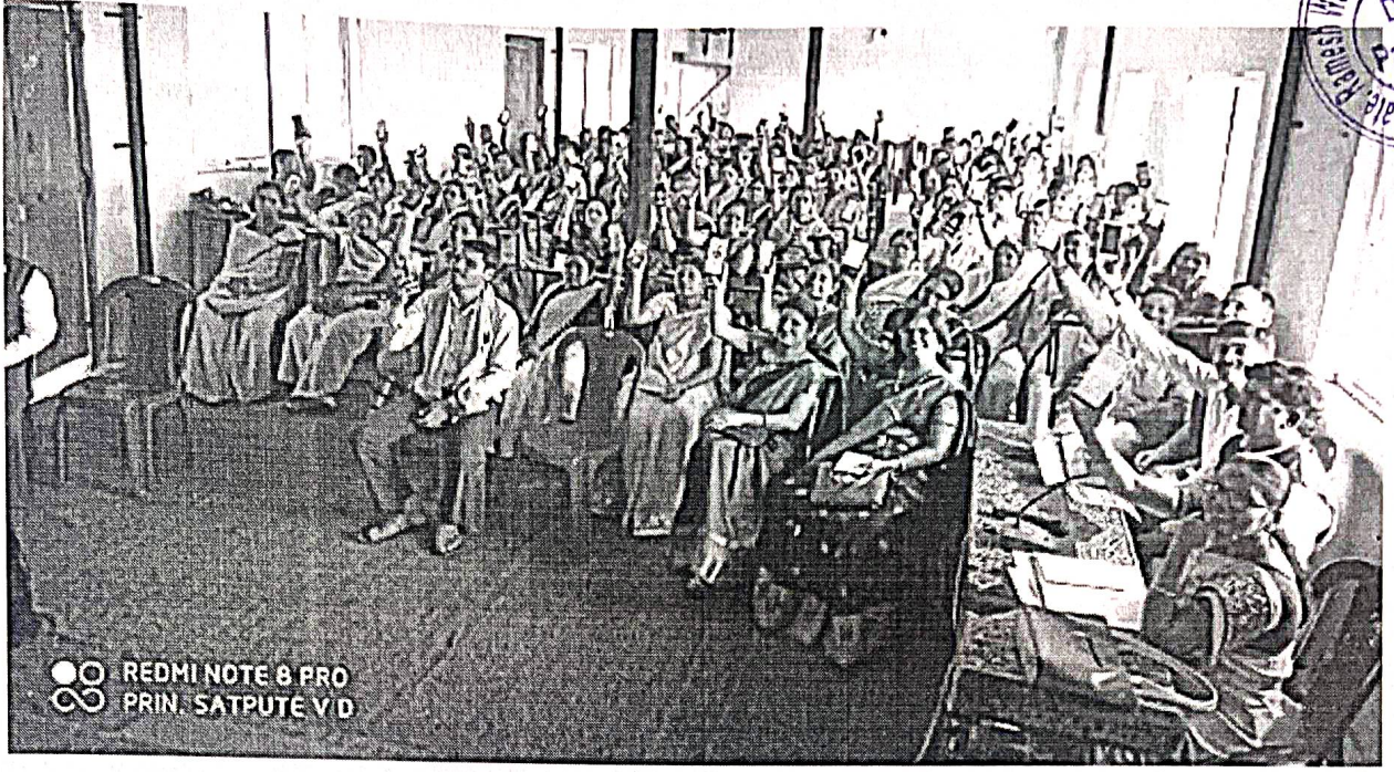
कार्यशाळेत सहभागी आशा कार्यकर्त्या, अंगणवाडी सेविका, शिक्षिका व गृहीणी