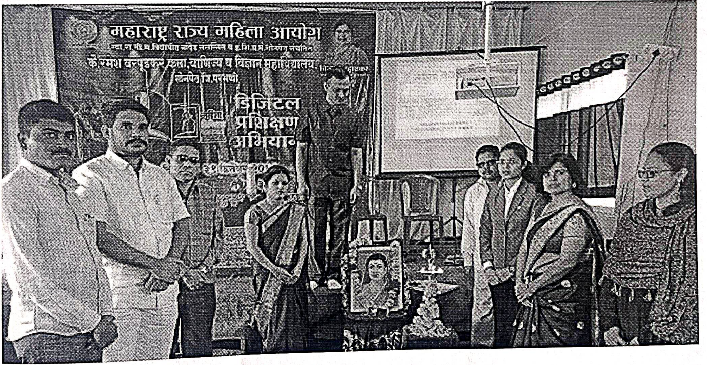
एक दिवसीय राज्यस्तरीय कार्यशाळा 'डिजीटल साक्षरतेतून महिला सबलीकरण' उदघाटन प्रसंगी उपस्थित मान्यवर