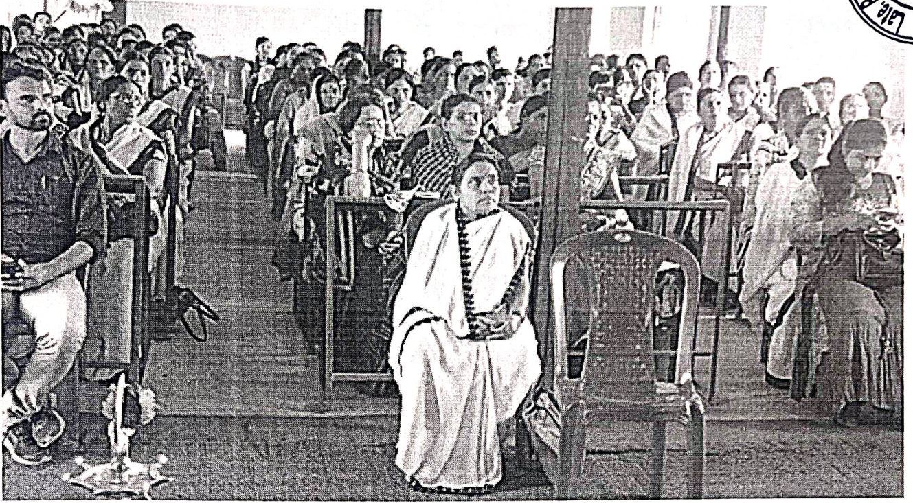
एक दिवसीय राज्यस्तरीय कार्यशाळा 'डिजिटल साक्षरतेतून महिला सबलीकरण' प्रसंगी उपस्थित महिला